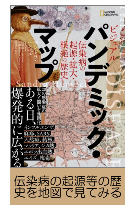
伝染病の起源等の歴史を地図で見ている