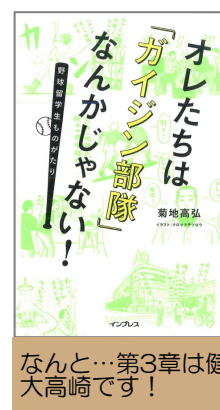
なんと…第3章は健大高崎です！