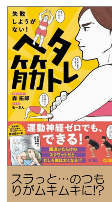
スラっと…のつもりがムキムキに!?