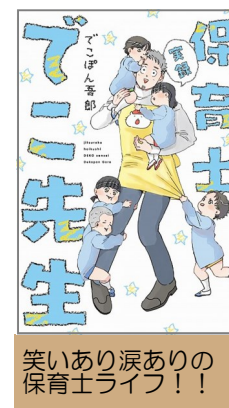
笑いあり涙ありの保育士ライフ！！