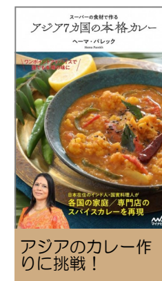
アジアのカレー作りに挑戦！