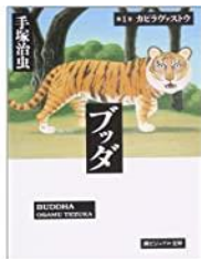
ブッダ1巻潮漫画文庫

昨年に引き続き、コロナ禍の影響で行動が制限された中でのスタートです。思うようにできず焦ったり不安に思うこともあるかと思います。まずは、大きく深呼吸、そして周りを見てください。自信が持てないときは自分だけがうまくいっていないような錯覚に陥りやすいのですが、案外周りも似たり寄ったりです。そして、自分の生活リズムをしっかりと作っていきましょう。朝起きる、夜寝る時間などのリズムが整ってくると体も心もずいぶん楽になっていきます。