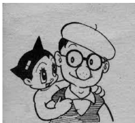
手塚治虫氏自画像より引用

カウンセラーは月曜と金曜にいます。 保護者の方もお気軽にどうぞ。電話相談もできますので、まずご連絡ください。